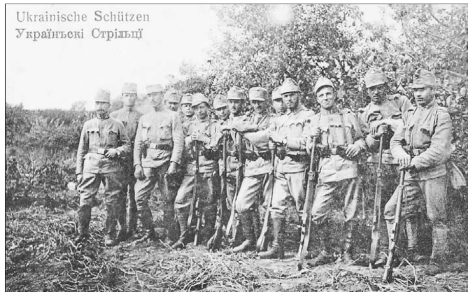
Ukrainische Schützen Українські Стрільці